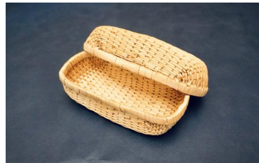
柳で丁寧に編み込んだ「柳行李」

竹や柳を丁寧に編み込んだ弁当箱や杉や檜などの木材を加工した弁当箱は、軽くて丈夫な上に抗菌性・通気性・保湿度など、それぞれの素材が持つ特長が活かされています。例えば木材を薄く加工し曲げて作る「曲げわっぱ弁当」は、木肌が食材の湿気を吸収することで、食材が傷みにくく、美味しさを長持ちさせる特性があります。