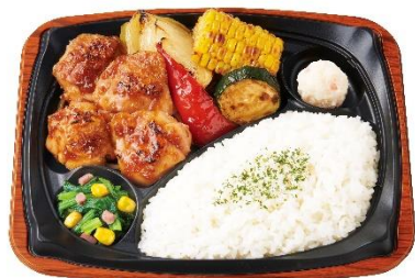
グリル野菜&グリルチキンプレート 720円