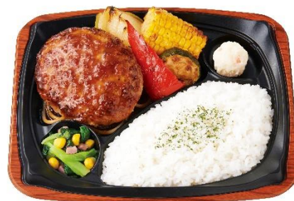
グリル野菜&和風ハンバーグプレート 790円

リニューアルした“グリル野菜”とジューシーなハンバーグを組み合わせた『グリル野菜&和風ハンバーグプレート』を新発売いたします。牛肉と豚肉のそれぞれの旨味が引き立つよう、黄金比率（牛7：豚3）で仕上げたこだわりのハンバーグには、2種の本醸造醤油に玉ねぎの旨味を加えた和風ソースを合わせました。夏野菜とジューシーなハンバーグの期間限定の組み合わせをお楽しみください。