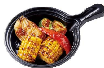
グリル野菜盛り合わせ 420円