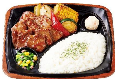
グリル野菜&ビーフステーキプレート 890円