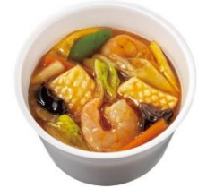
海鮮中華あんかけ おかずのみ 590円