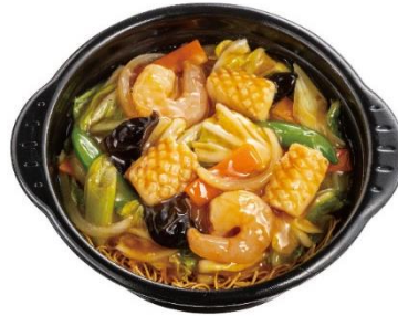
海鮮中華あんかけかた焼きそば 740円