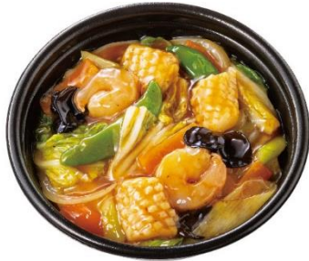
海鮮中華あんかけごはん 690円