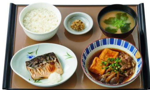
肉豆腐と焼魚の定食 860円(税抜782円)

「やよい軒」ではこれからもお客様の満足と健康を実現し、人びとに笑顔と感動をお届けし続けることができるよう邁進してまいります。