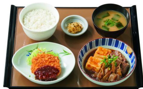
肉豆腐とメンチカツの定食 860円(税抜782円)