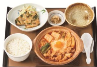
チゲ定食 890円(税抜 810円)