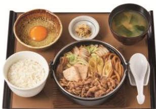
すき焼き定食 890円(税抜 810円)