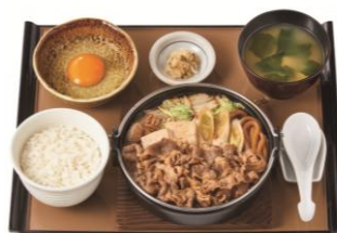
特すき焼き定食 1,290円(税抜 1,173円)