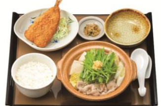
しょうが鍋定食 890円(税抜 810円)