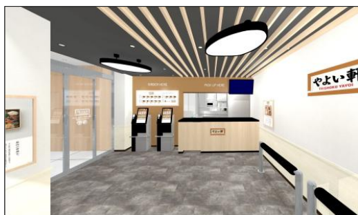
テイクアウト店内