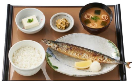
さんまの塩焼定食 690円(税込)

「やよい軒」ではこれからもお客様の満足と健康を実現し、人びとに笑顔と感動をお届けし続けることができるよう邁進してまいります。