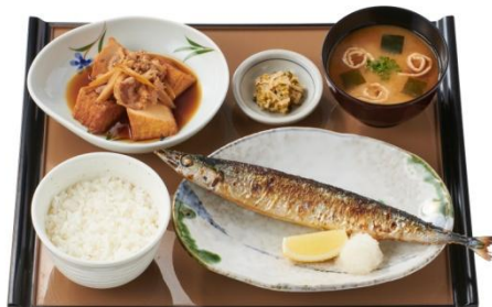
さんまの塩焼と肉豆腐の定食 860円(税込)