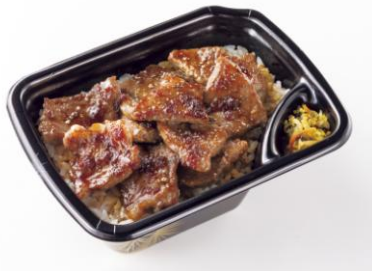
カットステーキ重 590 円(税込)