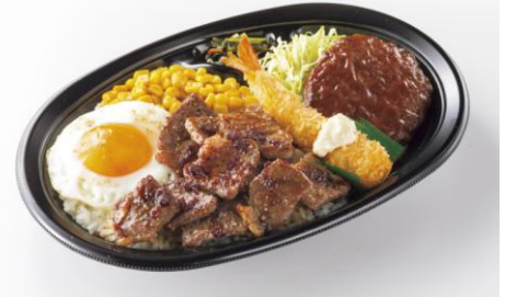
カットステーキコンボ 890 円(税込)

カットステーキ、デミグラスハンバーグ、 エビフライ、目玉焼きなどをワンプレートに