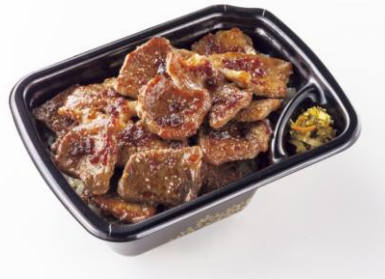
W カットステーキ重 890 円(税込)