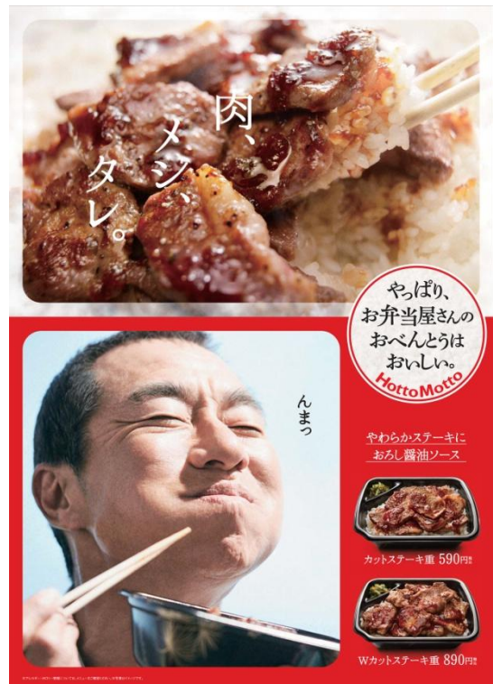
※ステーキ肉は調味液に浸漬しております

また、カットステーキとともにデミグラスハンバーグ、エビフライ、目玉焼きなどの多彩なおかずをワンプレートに盛り込んだ『カットステーキコンボ』は、ボリューム満点の仕上がりになっています。