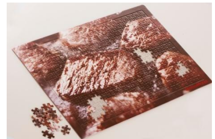
肉パズルイメージ

「ほっともっと」Twitter 公式アカウントでは 7 月 1 日(日)~22 日(日)の間、 『カットステーキ重』に関するクイズの正解者の中から抽選で 100 名様に、 超難関と評判の“のりパズル” “肉パズル”のいずれかが当たるキャンペーンを実施いたします。