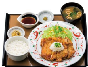
鶏もも一枚揚げ定食【おろしぼん酢】 890円(税込)