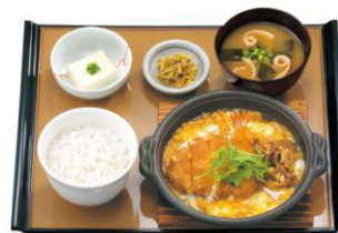
ミックスとじ定食 780円(税込)