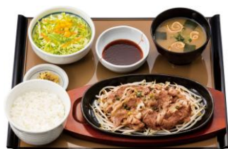
牛焼肉定食 720円(税込)