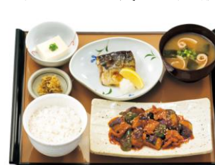
なす味噌と焼魚の定食 880円(税込)