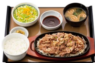
特盛牛焼肉定食 990円(税込)