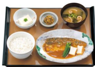
サバの味噌煮定食