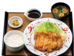
鶏もも一枚揚げ定食【にんにく醤油】 890円(税込)