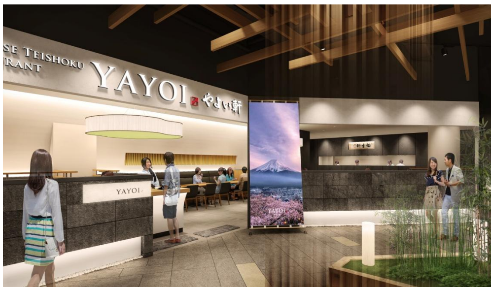
<店舗外観 イメージ>

店舗名 YAYOI Lot10(ロットテン)店 開店日 2018年1月18日(木) 住所 Lot P1, Unit P1-19, Level 4, Lot10 Shopping Centre, 50, Jalan Sultan Ismail, 50250 Kuala Lumpur, Malaysia 営業時間 午前11時～午後10時 席数 90席 メニュー 和の定食を中心に、井やうどん、アラカルト料理も取り揃えております