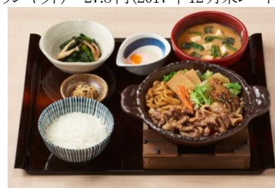
すき焼き定食 32 MYR