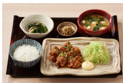
照焼きチキン定食 19MYR

※1MYR(マレーシア・リングgit) = 27.8円(2017年12月末レート)