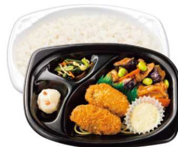
カキフライ&なす味噌弁当 590円(税込)