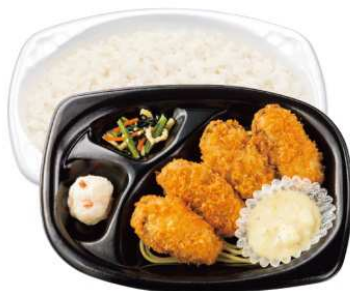
カキフライ弁当 620円(税込)