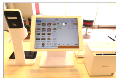
iPadを使用した新POSレジ