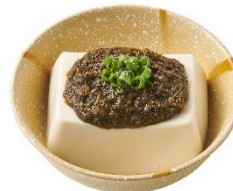
アカモク冷奴 250 円