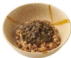
アカモク納豆 250 円